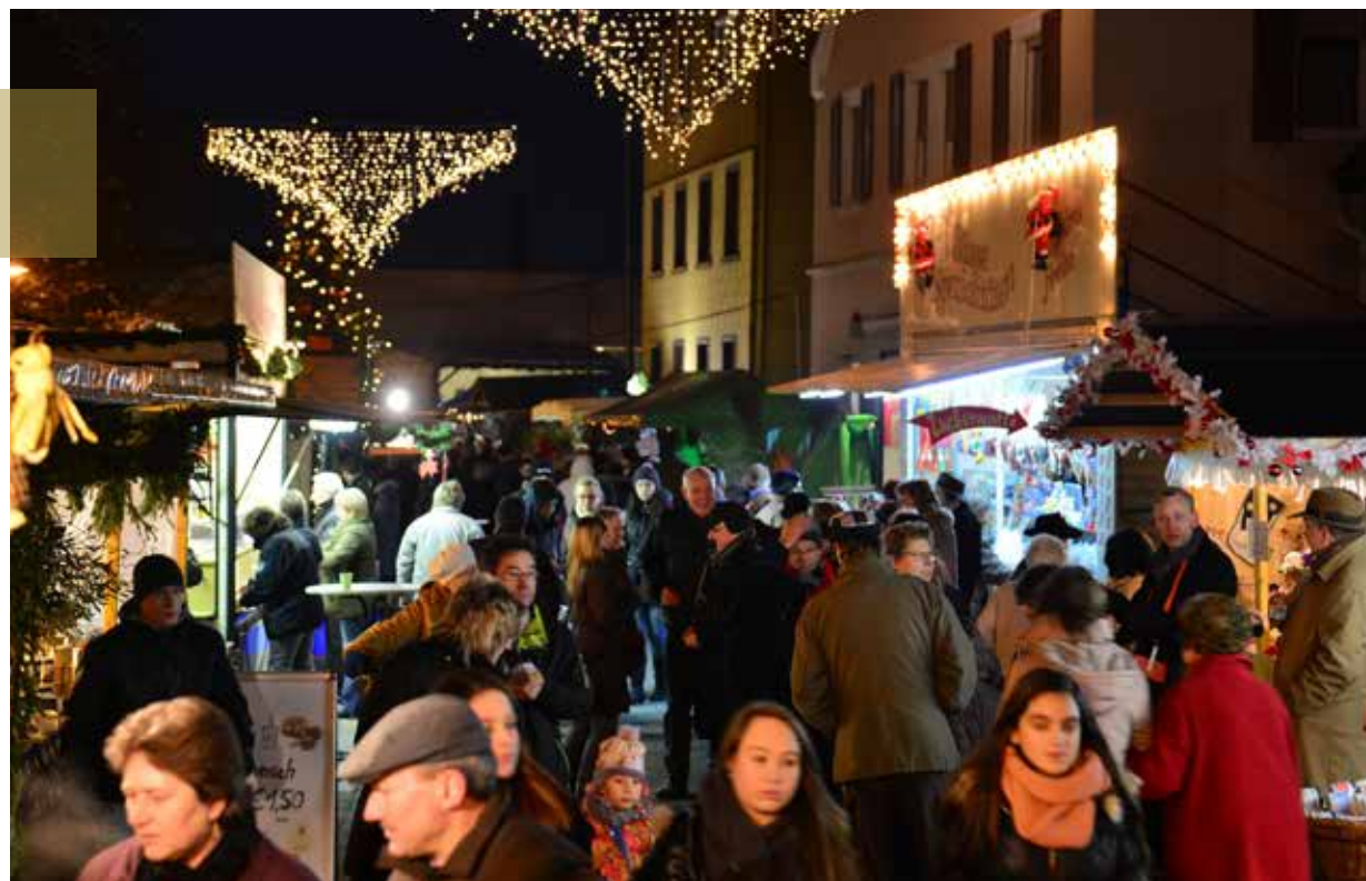
Der stimmungsvolle Weihnachtsmarkt in Eisingen

Richtung Ulm immer drängender. Die Zielsetzung, staufreie Verkehrswege durch Ausbau an den vorhandenen Achsen zu schaffen, steht nicht im Gegensatz zum Natur- und Landschaftsschutz. Gerade der Landkreis Göppingen hat ein unerschöpflich vielfältiges Landschaftsrepertoire. Vom Schurwald hoch zum Hohenstaufen, das Gebiet um das Rehgebirge, die beeindruckenden Charakteristiken der Täler wie Roggental und das Wieslaufftal, aber auch die Albhochflächen und das von Streuobstwiesen geprägte Albvorland sind nur einige Beispiele des facettenreichen Kreisgebiets. Gerade dieser Naturraum bringt viele regionale Produkte von Direkterzeugern hervor, die ich in den vergangenen Jahren als Genussvielfalt erleben durfte. Brandweine, Obstweine, Säfte, Hägenmark, Käse und vieles mehr werden zu „Produktbotschaftern“ des Landkreises und verleihen ihm eine bodenständige, liebenswerte Note. Dazu zählen auch längst etablierte und in Traditionsbetrieben vermarktete Regionalprodukte wie die Biere von der Kaiser-Brauerei Geislingen und der Brauerei Hilsenbeck aus Gruibingen. Übrigens: Der Gründer der Becks Biere hat sein Brauerei-Handwerk in der Adlerbrauerei in Eisingen gelernt.