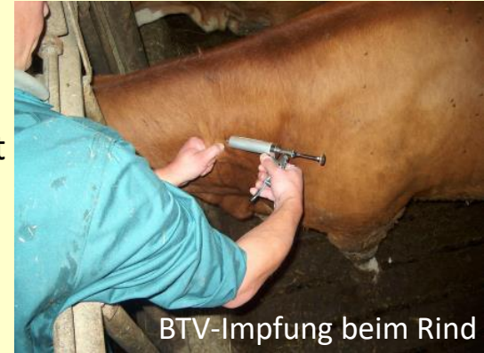
BTV-Impfung beim Rind

Das Verbringen empfänglicher Tiere aus BTV-Restriktionsgebieten in BTV-freie Gebiete bzw. Mitgliedstaaten ist über das EU-Recht geregelt (Del. VOs (EU) 2020/688 und 2020/689). Nach wie vor gilt, dass grundsätzlich nur korrekt geimpfte Tiere verbracht werden dürfen.